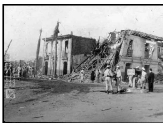
Fig. 6. Ruinas que dej  peligrosamente en pie la explosi n del 7 de agosto (1956). Fuente: Santiago de Cali, Biblioteca Departamental Jorge Garc s Borrero.

1956, de 6 camiones estacionados en los alrededores de la Estaci n del Ferrocarril sobre la Calle 25 entre Carreras 1 y 3, provenientes de Buenaventura y cargados con 42.000 kg de dinamita; no s lo por la cantidad de muertes y las p rdidas econ micas, sino por las secuelas sociales y culturales sufridas por el barrio San Nicol s. Para aquel entonces, Cali contaba con alrededor de 120.000 habitantes de los cuales m s de 2.000 murieron (s lo pudieron rescatarse 985 cad veres) y miles de personas resultaron heridas” (Vargas, 2014: 33).