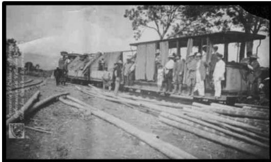
Fig. 1. Los trabajadores de la madera abordan el tranv a (1910). Fuente: Santiago de Cali, Biblioteca Departamental Jorge Garc s Borrero.

procesos de modernizaci n. A nivel regional, la conformaci n de Cali hace parte de un proceso de consolidaci n de centros urbanos construidos como respuesta a las grandes econom as de la ca a, el az car, y los productos agr colas que sirven de insumo para la agroindustria. El posicionamiento de las primeras grandes empresas al barrio San Nicol s se da hacia finales del siglo XIX, y se consolidan durante el siglo XX como el sector industrial de Cali ubicado en el barrio San Nicol s. Por esto, es significativa para el barrio la segunda oleada de modernizaci n de la regi n por los distintos procesos de industrializaci n de la primera mitad del siglo XX, como resultado del desarrollo econ mico empresarial de finales del siglo XIX. Durante la primera d cada del siglo XX se perciben procesos de industrializaci n de la ciudad, como la inauguraci n del primer tranv a de vapor el 20 de julio de 1910 (Celebraci n del Centenario del Grito de Independencia). Este hecho es importante para el barrio San Nicol s porque los talleres de la empresa del tranv a estaban ubicados en la Carrera 8 a con Calle 19.