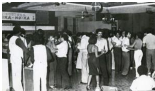
Fig. 14. Bland n, O. (1986). Personas bailando en la pista de baile de la Discoteca, Honka Monka. Fuente: Santiago de Cali, Biblioteca Departamental Jorge Garc s Borrero.

Durante la d cada de los 40's y los 50's, quienes han vivido el barrio tambi n llaman la atenci n sobre la importancia de los teatros para la vida social y cultural del barrio y Cali: El Teatro Palermo, El San Nicol s y El Sucre; y durante los 60's y 80's los grilles de la 8 a como el Grill San Nicol s y Honka Monka.