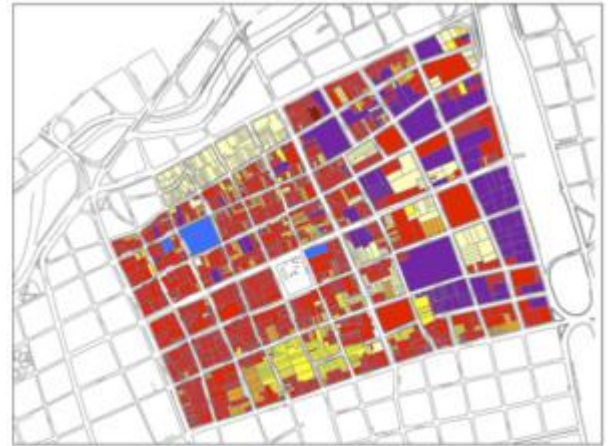
Fig. 8. Mapa de usos de suelo Barrio San Nicol s. Fuente: Informaci n recolectada en trabajo de campo.

En el siguiente mapa del barrio San Nicol s, se identificaron cuatro usos de espacio diferentes asociados a estas actividades: 1) comercial, 2) residencial, 3) industrial y 4) comercial-residencial. Se identificaron estos usos para la zona con menor o nula densidad de negocios dedicados a la industria de las artes gr ficas, las cuales corresponden a las tres cuartas partes que se encuentran en color. Actualmente el barrio est  compuesto en su mayor a por la actividad comercial como se observa en el mapa los predios identificados con color rojo y en segunda medida la actividad industrial, identificada con el color morado.