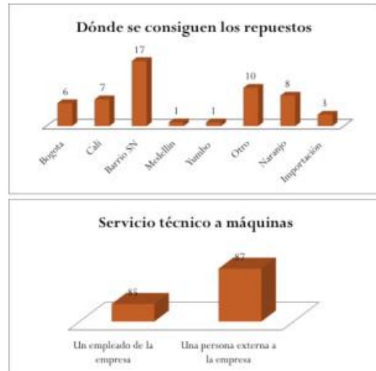
Fig. 10. Resultados de censo del sector de artes gr ficas del Barrio San Nicol s, ejecutado durante el proyecto. Fuente: Elaboraci n propia.

persona externa a la empresa para el servicio t cnico y reparaciones, lo que ha promovido la las relaciones comerciales con otros sectores del barrio. En esta medida, vale la pena reconocer que de las 53 empresas que suministraron la informaci n sobre el lugar en donde adquieren los repuestos, el 47% de  stas han creado relaciones comerciales con proveedores del mismo barrio.