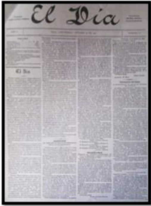
Fig. 4. Diario El Dia. Fuente: Carvajal Cien A os: edici n conmemorativa, 1904-2004. (2004). Carvajal, Colombia.

El incremento de la industria en Cali fue uno de los factores de desarrollo m s importantes para la regi n, logrando posicionar a la ciudad como uno de los nodos econ micos y pol tico-administrativos m s relevantes hacia mitad de siglo XIX. El auge del sector industrial del barrio San Nicol s durante este siglo, fue combin ndose con la vida social del mismo asociada a la actividad residencial que tanto lo caracteriz  desde sus inicios. Solo hacia finales de la d cada de los noventa se comenz  a hacer m s visible la actividad comercial que hoy en d a caracteriza el barrio y que lo identifica como un sector que expresa una mixtura de actividades comerciales e industriales combinadas con el uso residencial de sus espacios.