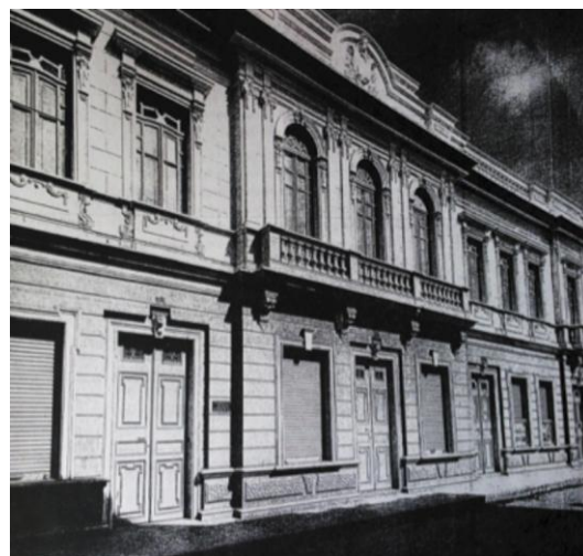
Fig. 3. Casa familiar en Carvajal. Carrera 5  entre calle 15 y 16. Fuente: Carvajal Cien A os: edici n conmemorativa, 1904-2004. (2004). Carvajal, Colombia, p. 22.

La imprenta de la familia Carvajal nace en la carrera 5  entre calle 15 y 16, como expresi n de un proceso de apropiaci n espacial de la industria gr fica sobre el barrio El Vallado, hoy San Nicol s, en el cual se asientan las tipograf as dedicadas a la impresi n de peri dicos y revistas, adem s de ser el barrio donde se ubicaron de la mayor a de los sindicatos.