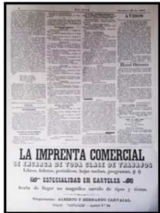
Fig. 2. Aviso de imprenta en diario El D a. Fuente: Carvajal Cien A os: edici n conmemorativa, 1904-2004. (2004). Carvajal, Colombia.

Seg n el Bolet n de Estad stica Municipal, No. 3 de julio de 1925, las 10 mayores fabricas existentes en Cali, en 1925 eran TRILLADORA DE CAF  ULPIANO LLOREDA (con 212 trabajadores), TRILLADORA DE CAF  ALFONSO VALLEJO (con 199 trabajadores), TRILLADORA DE CAF  “EL QUINDIO” (con 131 trabajadores), TEJIDOS ANTONIO DISHINGTON (La Garant a) (con 68 trabajadores), CERVECERIA ALEMANA “LOS ANDES” (con 60 trabajadores), TRILLADORA DE CAF  GUERRERO (con 45 trabajadores), TIPOGRAFIA CARVAJAL (con 39 trabajadores), TIPOGRAFIA PALAU, VELASQUEZ & CIA. (con 30 trabajadores), GASEOSAS POSADA TOBON (con 30 trabajadores) y FUNDICION D AZ M. HERMANOS (con 30 trabajadores).